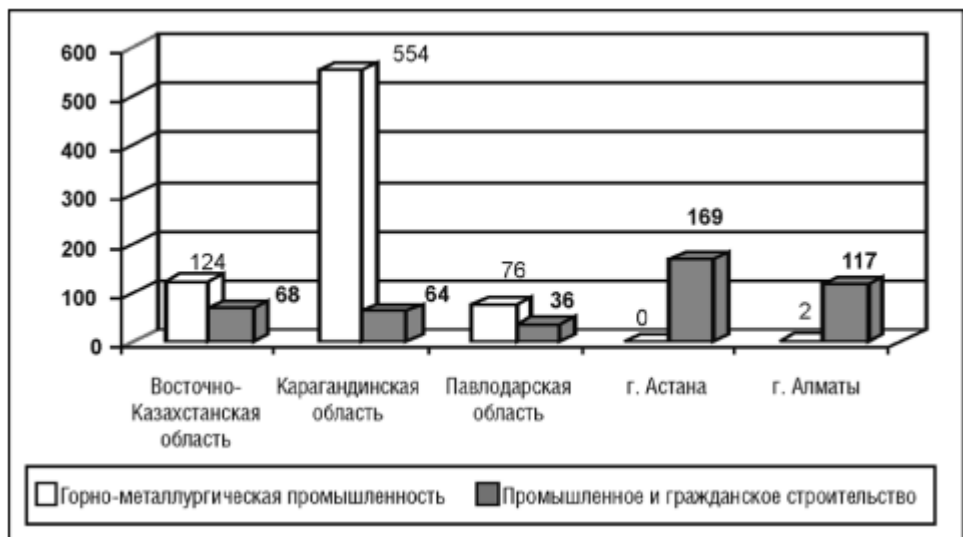
122 Диаграмма 4