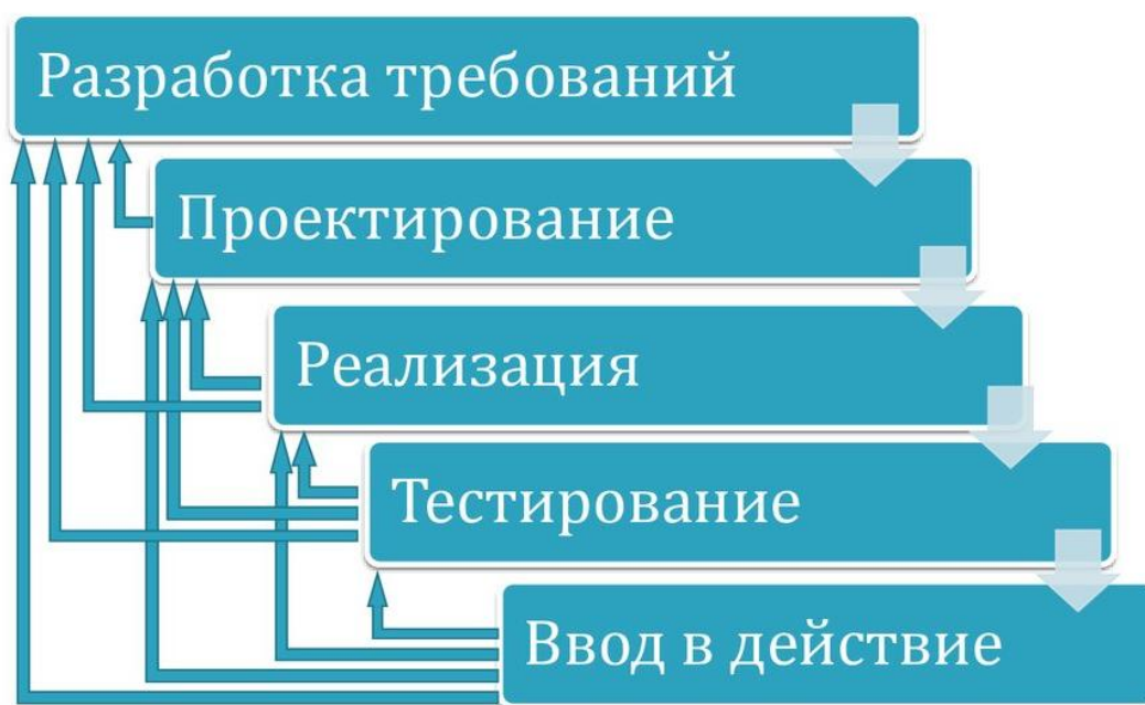
Рисунок 2.2 – Поэтапная модель с промежуточным контролем

Спиральная модель (рис. 2.3). На каждом витке спирали выполняется создание очередной версии продукта, уточняются требования проекта, определяется его качество и планируются работы следующего витка. Особое внимание уделяется начальным этапам разработки - анализу и проектированию, где реализуемость тех или иных технических решений проверяется и обосновывается посредством создания прототипов (макетирования).