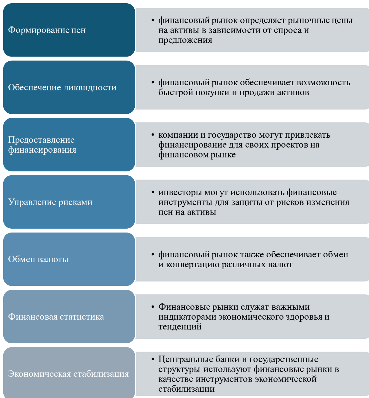
Рисунок 1 – Основные функции финансового рынка

Также благодаря различным инструментам финансового рынка появляется возможность роста сбережений и накоплений для формирования инвестиционного капитала и роста богатства как отдельных участников рынка, так и государства в целом. В частности, инвестируя в акции, облигации и другие активы, частные лица могут увеличивать свое богатство, планировать выход на пенсию и достигать финансовых целей.