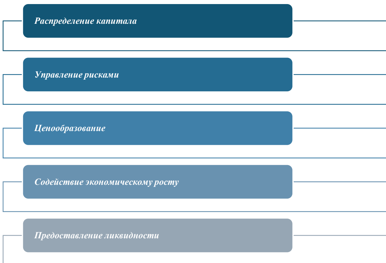
Рисунок 3 – Основные функции рынков капитала

Одной из основных функций рынков капитала является эффективное распределение капитала. Инвесторы направляют свои сбережения в продуктивные инвестиции, позволяя компаниям финансировать новые проекты, исследовательские инициативы и операционные расширения. Этот процесс распределения способствует экономическому развитию, направляя ресурсы в предприятия с наивысшей потенциальной доходностью.